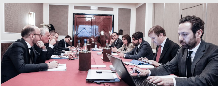
Un momento della tavola rotonda di ieri

Ieri, Insurance Connect ha organizzato una tavola rotonda con i responsabili delle aree marketing e distribuzione di alcune tra le principali compagnie italiane. Tecnologia, valore del brand, fidelizzazione: tutto il resoconto completo sul numero di febbraio di Insurance Review