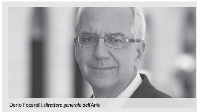
Dario Focarelli, direttore generale dell'Ania

L'Italia è uno dei Paesi più arretrati per educazione finanziaria: si può parlare di vero e proprio analfabetismo. Il direttore generale dell'Ania, Dario Focarelli, affronta il tema nel corso di un'audizione al Senato