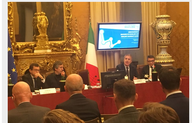
Un momento della presentazione