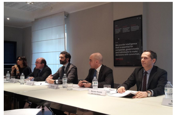
Un momento della conferenza annuale di S&P