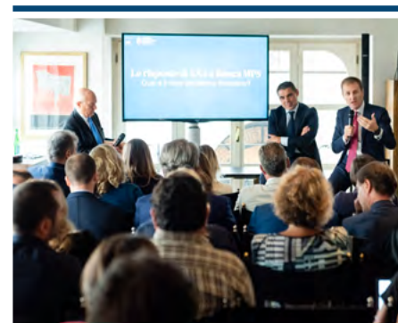
Un momento dell'evento