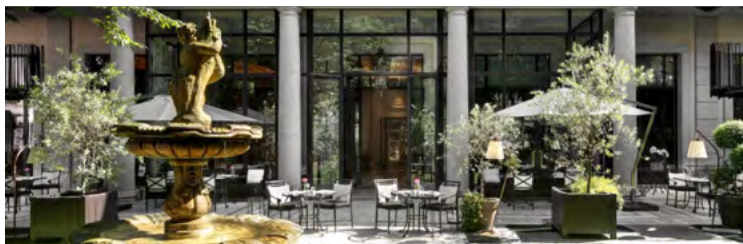
Palazzo Parigi a Milano