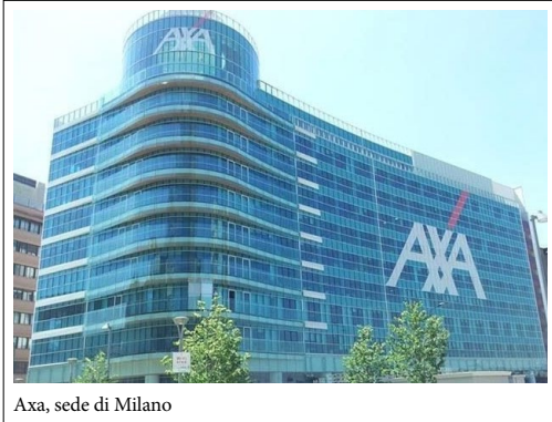
Axa, sede di Milano