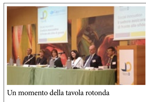
Un momento della tavola rotonda

Dalla survey di McKinsey, è emerso come da qualche anno, la sensibilità rispetto alla gender diversity, soprattutto all'interno delle aziende, sia molto cresciuta. Ma restano difficoltà derivanti dal contesto sociale. Qualche numero per capire: le donne che lavorano sono il 46% in Italia, contro il 60% della media europea; il 40% delle donne non occupate sono laureate o diplomate; il 60% della mamme lavoratrici non rientrano in azienda dopo il secondo figlio; è pari al 12% la presenza delle donne nei cda (prima dell'introduzione delle quote rosa il dato di fermava al 5%). (continua a pag.2)