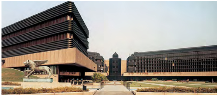
La sede di Generali Italia a Mogliano Veneto