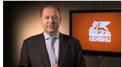
Philippe Donnet, group ceo di Generali

Nel dettaglio, la lista presentata dal board uscente ha ottenuto il 55,992% del capitale presente in assemblea (corrispondente al 39,6% del capitale totale di Generali). A favore della principale lista concorrente, quella di Caltagirone, ha votato il 41,73% del capitale presente in assemblea (corrispondente al 29,5% del capitale ordinario). Più defilata Assogestioni , che ha ottenuto l'1,929% dei voti. L'affluenza è stata da record, pari al 70,73% del capitale, un numero enorme soprattutto se confrontato con il 55,9% dell'assemblea di tre anni fa.