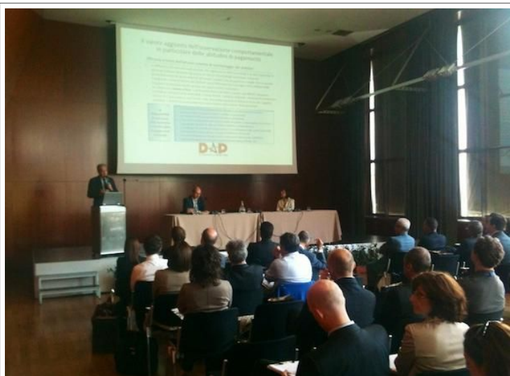
Kick off servizio Dap, database delle abitudini di pagamento, Centro Svizzero di Milano