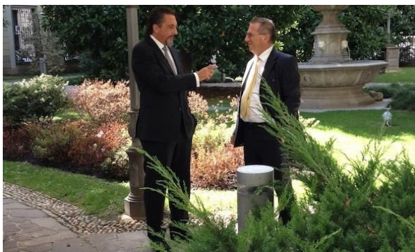
Carlo Cimbri (a sinistra), amministratore delegato del Gruppo Unipol