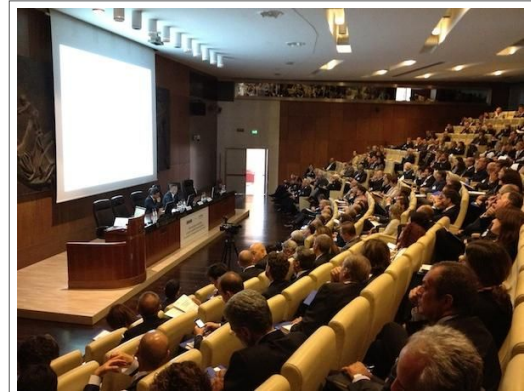
Insurance Day, auditorium Fondazione Cariplo