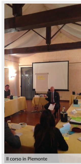
Il corso in Piemonte

Il progetto, che prevede un laboratorio formativo, strutturato su tre giornate, che insegna ai fruitori (dirigenti e quadri delle sezioni provinciali), il modo più efficace di comunicare ai potenziali iscritti al sindacato i benefici dell'associazionismo, si sviluppa in due fasi. (continua a pag. 2)