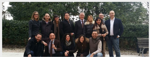
Il corso in Veneto e Trentino Alto Adige

(continua da pag. 1) “La prima strettamente formativa e motivazionale – spiega Occhipinti – si snoderà in 11 tappe e coinvolgerà tutte le regioni da Nord a Sud, laddove la scelta della location non è casuale, ma finalizzata a meglio valorizzare lo spirito di squadra che man mano si sta formando, con il ritrovato piacere di stare insieme, accomunati dalla stessa passione per il lavoro e le cose in cui crediamo; fra l’altro, stiamo registrando una nutrita partecipazione di giovani agenti che, affiancati dai loro presidenti provinciali, stanno producendo moltissime idee con tanta voglia di fare, dando ancora più vigore al nostro progetto. Una parte della giornata sarà, poi, dedicata alla tutela e all’assistenza sindacale ai colleghi in caso di revoche, ispezioni, vero