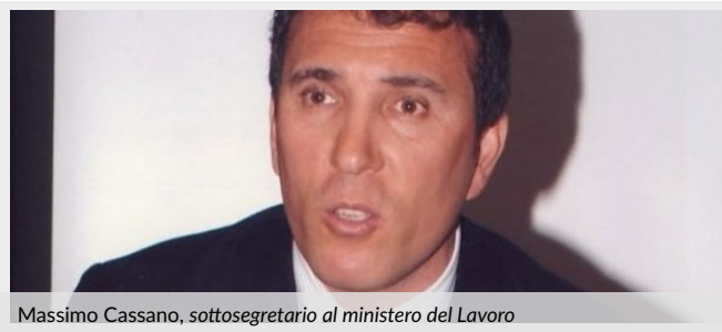
Massimo Cassano, sottosegretario al ministero del Lavoro

Lo spettro temuto dalla categoria appare vicino: la Covip ha già avanzato la richiesta al ministero. Questa settimana l'ultimo tentativo per scongiurare il peggio